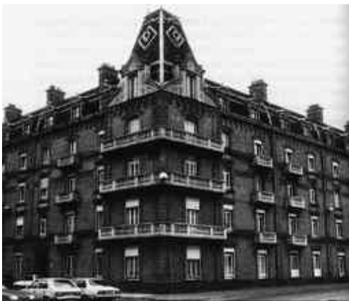
L'aile droite du "palais social" voulu à Guise par Jean-Baptiste Godin pour procurer à ses ouvriers "les équivalents de la richesse" (reconstruction de 1923).

Le créateur des fameux poêles Godin était issu d'une famille d'artisans de cette Thiérache dont la tradition métallurgique remonte au Moyen âge. Né en 1817 dans le village d'Esquéhéries, il fait son tour de France entre 1834 et 1837, puis de retour chez lui, se lance dans la fabrication d'un nouveau modèle de poêle pour le chauffage domestique. Jusque là on utilisait des poêles en tôle qui brûlaient du bois. Le trait de génie de Godin consiste à proposer un poêle en fonte, qui fonctionne aussi bien au bois qu'au charbon, donc plus souple, moins encombrant, adaptable à tous types d'intérieurs. C'est le succès. En 1842, il s'installe avec 32 ouvriers, près de son village d'origine, aux portes de la ville de Guise, où il avait trouvé des terrains bon marché et une main d'œuvre disponible, abondante et peu chère.