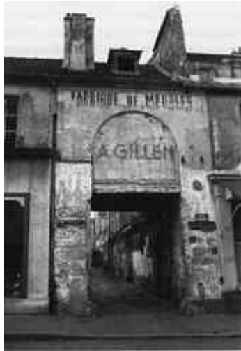
Avant démolition pour opération d'urbanisme dans l'îlot: le porche d'entrée de la "Cité Delaunay", à Paris, donnant accès à un système de passages et abritant des ateliers variés.

traditionnelle, ce qui ne leur a pas épargné pour autant la fureur destructrice des promoteurs et aménageurs.