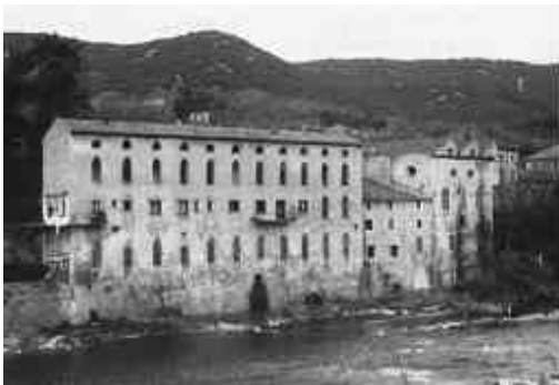
Anciennes filatures de soie à Ganges au bord de l'Hérault.

En effet, malgré des débuts prometteurs, au XVIe et au XVIIIe siècles, malheureusement compromis par la politique de répression contre les protestants dans la période qui précède et accompagne la Révocation de l'Edit de Nantes, c'est à partir du XVIIIe siècle que se développe la culture du mûrier et les activités qui en découlent: tirage, moulinage, tissage, bonneterie. Dans les fermes et dans les villages, on installe des magnaneries; chaque famille possède un tour et file sa propre récolte; des manufactures se créent; les foires de Beaucaire et d'Alès consacrent cet essor, particulièrement sensible dans la deuxième moitié du siècle. C'est que la