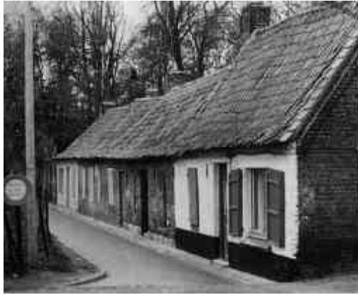
niveau par unité d'habitation, la porte séparant une pièce à vivre et une pièce réservée au métier.

Il est cependant une autre forme d'immersion du bâti industriel, c'est celle qui dissimule la présence du travail du fait de son logement dans un cadre non spécifique, ou de son installation hors de la vue directe, à l'abri des immeubles qui donnent sur rue. Le premier cas est typique de la proto-industrie textile des villages ou faubourgs urbains, qui abritait un ou plusieurs métiers à tisser sous le toit familial, ou dans un apprentis, ou encore dans un sous-sol à demi-enterré. Les exemples s'en font rares de nos jours; mais il est encore possible de reconnaître, dans une architecture banale, apparemment rurale et paysanne, le détail de structure qui dénonce la présence antérieure du tisserand. Dans un cas très particulier d'organisation du travail, celui de la fabrique lyonnaise, le travail du canut, cet inclassable ouvrier-patron travaillant à façon, a déterminé l'entassement sur la colline de la Croix-Rousse d'immeubles qui mériteraient de s'appeler industriels, puisque leurs plafonds élevés, leurs baies étroites et hautes répondaient aux exigences à la fois d'éclairage et de montage des encombrants métiers Jacquard, une machine à bras complexe élaborée au début du XIXe siècle pour la fabrication des tissus de soie façonnés. Rien ou presque ne restera peut-être demain de ces bâtisses robustes et originales.