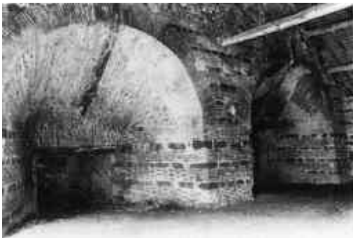
Trou de coulée et admission d'air à la base du haut-fourneau (Forges de Buffon, Côte d'Or).

Le haut-fourneau et ses annexes occupaient une terrasse qui surplombait de 7m. le cours dévié de l'Armançon. En contrebas, la roue hydraulique actionnait les souffleries. L'ensemble roue et soufflerie a été reconstitué par les classes d'établissements d'enseignement technique et mis en place depuis quelques années. Au-delà, on trouvait la forge, la fonderie et l'aire de lavage du minerai, espaces de travail qui fonctionnaient à l'aide d'autres roues hydrauliques: on en a compté jusqu'à onze! C'est là que les «gueuses" sorties du haut-fourneau étaient purifiées de leur carbone et travaillées en formes élémentaires (barres, tôles, etc.). La forge comportait deux foyers d'affinerie avec leurs souffleries respectives et deux marteaux à ordons, le tout mu à l'hydraulique. Plus loin, la fonderie comprenait la fonderie proprement dite, une batterie servant à la fabrication de la tôle et un martinet pour la fabrication de petits fers et la mise en forme d'éléments d'outils et de