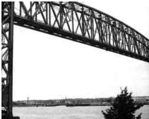
Pont ferroviaire mobile sur le canal séparant Cape Cod du continent (Massachusetts).

Dans la période de la reconstruction qui suivit la Libération, cette technique connut de nombreuses applications. Mais dès 1930 Freyssinet avait produit son «classique», le pont sur l'estuaire de l'Elorn en amont de la rade Brest, aux trois arches de 186 mètres de portée. Désormais la décision de choisir parmi les trois ou quatre solutions techniques dont dispose aujourd'hui l'ingénieur des Ponts relève, comme pour bien d'autres édifices, à la fois de conditions de compétitivité et aussi de la préférence accordée selon les pays, à telle ou telle culture (métal vs.béton, en particulier, voir sur thème: Frédéric Seitz, L'architecture du fer en France au XXe siècle, Paris, Belin, 1995).