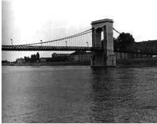
Le pont suspendu de Tournon sur le Rhône, dû à Marc Seguin (1825).

C'est entre 1928 et 1933 que Freyssinet mit au point la fabrication industrielle de ce béton soumis à une très forte compression sur des fils d'acier soumis eux-mêmes à un fort étirage, parvenant à des économies de poids total de 40%, et même des deux tiers pour le métal.